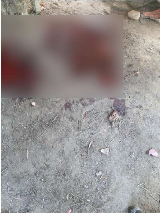
ပုံ (၄) - လေကြောင်းပစ်ခတ်မှုကြောင့် သေဆုံးသူ မပွင့်ဖြူဇာဝင်း (၂၀ နှစ်)၏ အသားစများ။