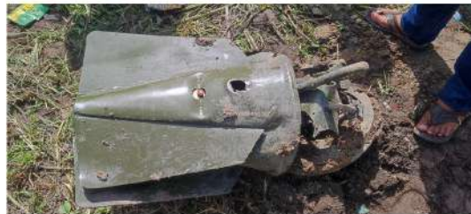
ပုံ (၇၊ ၈၊ ၉) - လေယာဉ်မှ ပစ်ခတ်လိုက်သော လက်နက် အပိုင်းအစများ။