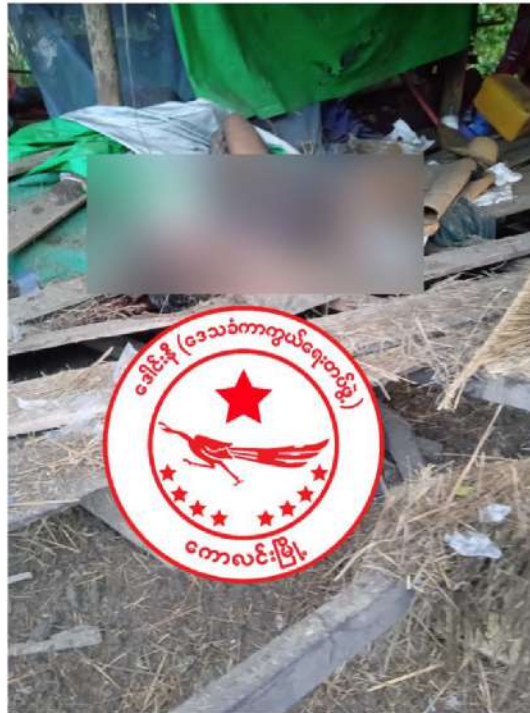
ပုံ (၂) - လေကြောင်းပစ်ခတ်မှုကြောင့် သေဆုံးသူ ကိုဇင်မျိုးသူ (၂၂ နှစ်)။