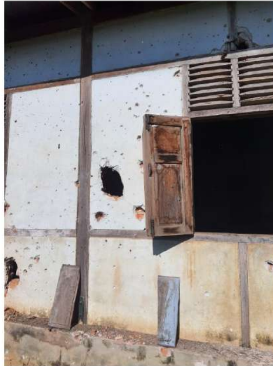
ပုံ (၅၊ ၆) - လေကြောင်းပစ်ခတ်မှု ကြောင့် သစ်ဆိမ့်ကုန်းရွာ စာသင်ကျောင်း ထိခိုက်ပျက်စီးမှု။