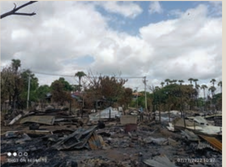
ပုံ(၅) - ကုန်းတဲရွာအတွင်း မီးရှို့ဖျက်ဆီးခံထားရသည့် မြင်ကွင်း။