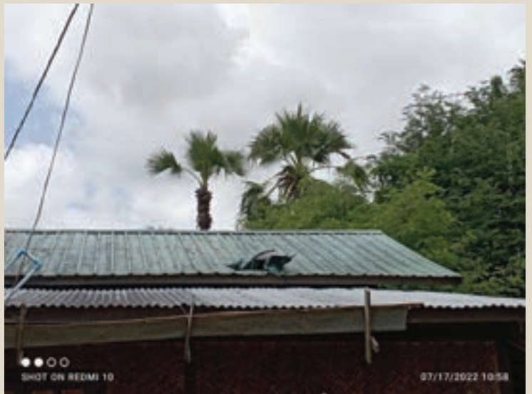
ပုံ(၂) - လက်နက်ကြီးကြောင့် ထိခိုက်ပျက်စီးသွားသည့် ဒေသခံပြည်သူတစ်ဦး၏ နေအိမ် အဝေးမှမြင်ရပုံ။