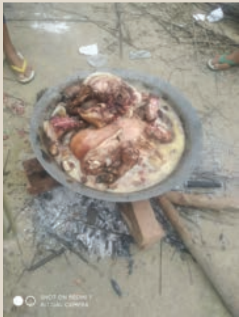
ပုံ(၁၀) - စစ်ကောင်စီတပ်သားများ ချက်ပြုတ်စားသောက်ခဲ့သည့် ဝက်သားအကျန်များကို တွေ့ရစဉ်။