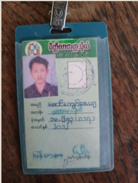
ပုံ(၁) - စစ်ကောင်စီတပ်သား တစ်ဦးထံမှ ကျကျန်ခဲ့သည့် ကျောင်းသားကဒ် (အရှေ့ဘက်)