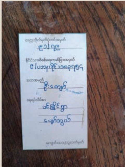
ပုံ(၂) - စစ်ကောင်စီ တပ်သား တစ်ဦးထံမှ ကျကျန်ခဲ့သည့် ကျောင်းသားကဒ် (အနောက်ဘက်)