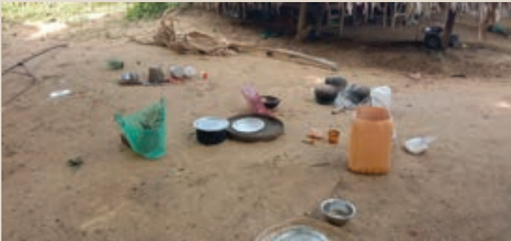
ပုံ(၇) - စစ်ကောင်စီတပ်သားများ ချက်ပြုတ်စားသောက်ခဲ့ပြီး ပစ္စည်းများ ပုံထားခဲ့ပုံ။