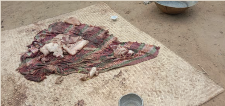
ပုံ(၅) - စစ်ကောင်စီတပ်သားများ ကျေးရွာအတွင်း ဝင်ရောက်ဖျက်စီးထားပုံ။