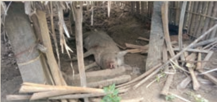
ပုံ(၆) - စစ်ကောင်စီတပ်သားများ ကျေးရွာအတွင်း ဝင်ရောက်ဖျက်စီးထားပုံ။