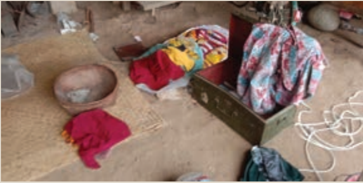
ပုံ(၄) - စစ်ကောင်စီ တပ်သားများ အိမ်အတွင်း ဝင်ရောက်ခဲ့ပြီး အခြေအနေ။